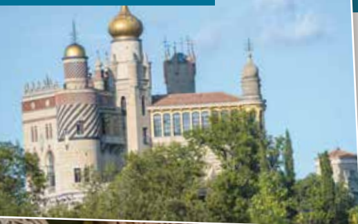
Santuario a Rocca Mattei

Abbiamo in cantiere molte sorprese che spaziano dagli incontri con scrittori, alle letture ad alta voce, dalle escursioni in centri storici minori e vicini, a visite a musei un po' dimenticati... non per questo meno affascinanti, dove non c'è la ressa delle mostre super reclamizzate, ma la scoperta individuale di opere od oggetti affascinanti.