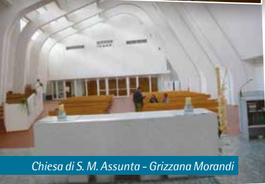
Chiesa di S. M. Assunta - Grizzana Morandi